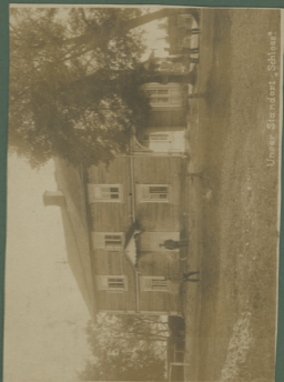
„Unser Standort“ „Schloß“