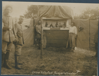
Unser Volksfest „Kasperletheater“