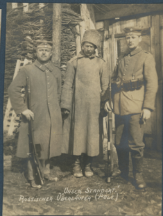
Unser Standort, Russischer Überläufer (Pole)